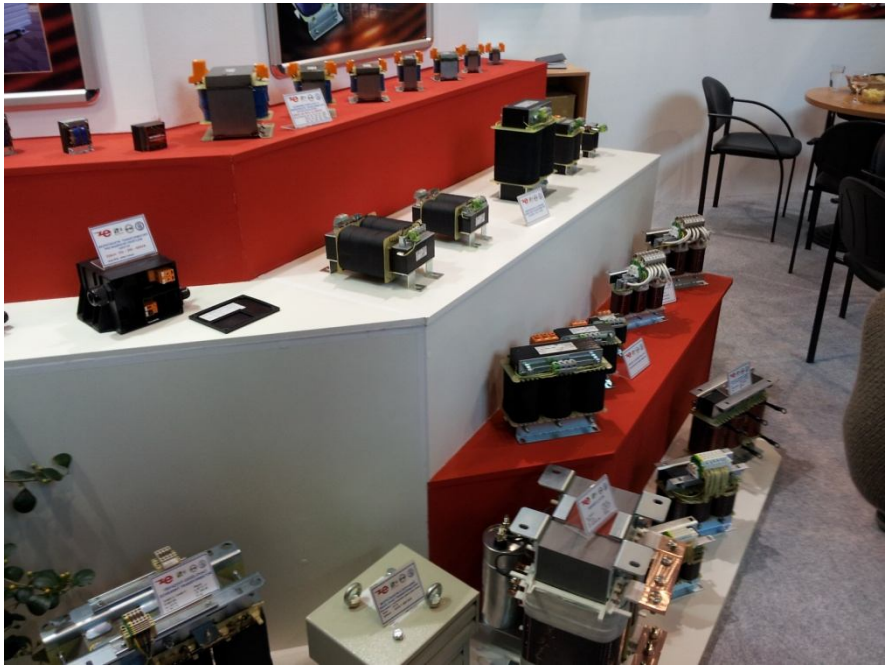
Készítette: Czautd Zoltán